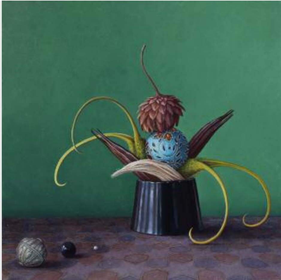
"Drei + 1 Kugel", 2010, Öl/Eitempera auf Holz, 40 x 40 cm

In diesem Intensivkurs können Beginnende und all jene, die schon etwas erfahrener sind, mit der Technik der alten Meister in Öl und Eitempera/Acryl vertraut gemacht werden. Es wird auch die feine Aquarelltechnik alter Meister gelehrt. Blumen, Früchte, Faltenwürfe, Stillleben, aber auch Portraits, Tiere und Landschaft nach mitgebrachten Fotos dienen uns als Motiv, werden genau studiert und zum Inhalt der Bilder. Außerdem werden Grundlagen zur Materialkunde und Komposition vermittelt.