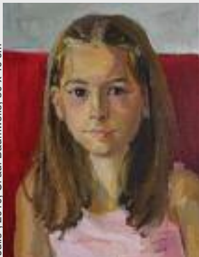
"Julie", 2010, Öl auf Baumwolle, 50 x 40 cm