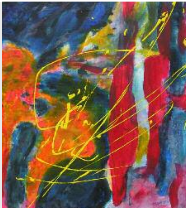
"Bunte Welt", 2012, Acryl auf Leinwand, 80 x 70 cm