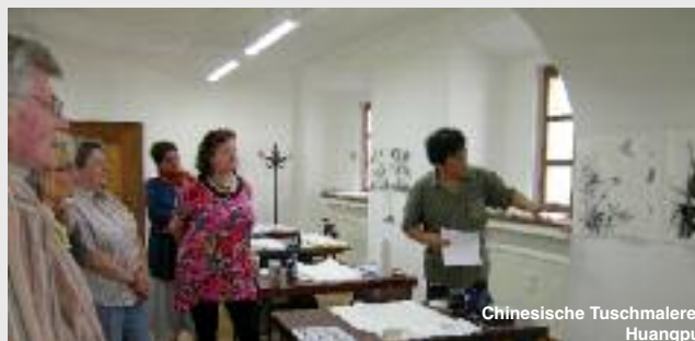
Chinesische Tuschmalerei Huangpu

Individuelle Betreuung wird bei uns groß geschrieben. Unsere Kursleiter/innen lassen Sie gerne an ihrem fundierten und praxisorientierten Wissen teilhaben. Beginnenden wie Fortgeschrittenen jeden Alters stehen unsere Dozent/innen kompetent und einfühlsam mit Rat und Tat zur Seite.