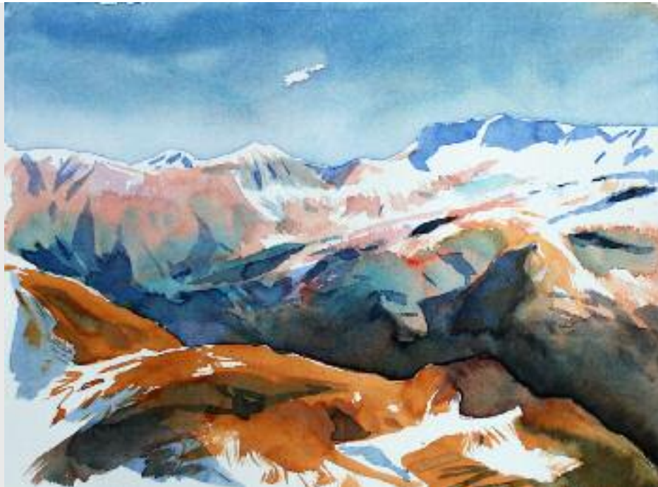
o.T., 2012, Aquarell, 30 x 40 cm