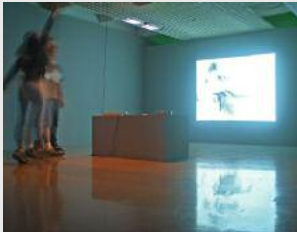
Nicolaj Kirisits, "Echos", interaktive Soundinstallation, 2005