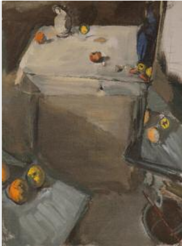
"Stilleben im Raum", 2010, Tempera und Öl auf Molino, 80 x 60 cm

In diesem Kurs beschäftigen wir uns mit dem Handwerk Malerei, dem Öl- und Temperamalerei. Denn letztlich hängt unser ganzes Bemühen um ein gutes Bild von der Neugier auf das bearbeitete Material ab! Das gute Bild, sein Ausdruck wirkt nur über das aufgetragene Farbmaterial, kein Wort kann den "Tatbestand" der vermalten Farbe ändern! Das ist die Stärke der Malerei und gleichzeitig die große Herausforderung dieses altbewährten Mediums: deshalb ziehen wir selbst die Leinwand auf den Holzkeilrahmen auf und grundieren sie fachgerecht mit selbst erzeugten Kreidegründen. Deshalb fertigen wir unsere Farbe selber, indem wir ausgewählte Pigmente mit speziellen Ölen und