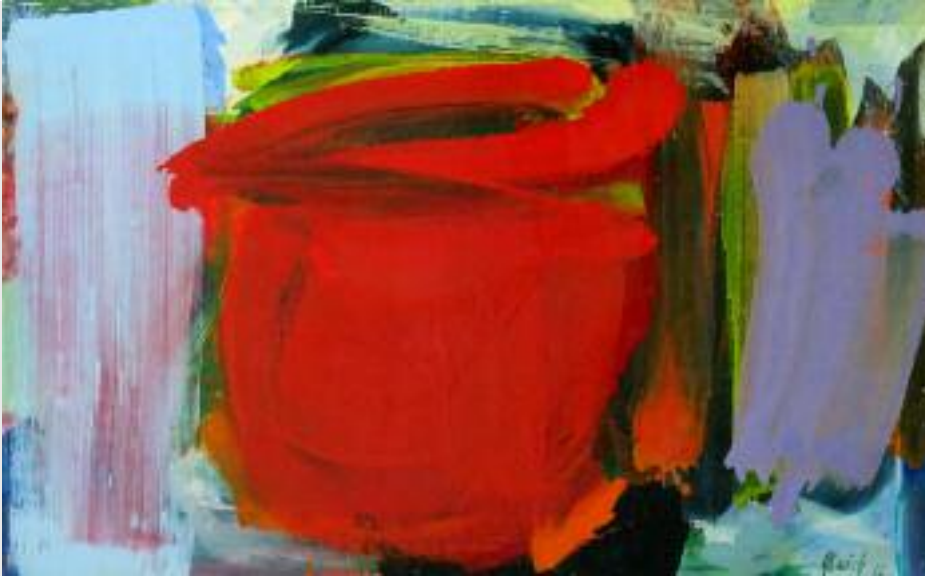
o.T., 2012, Öl auf Leinwand, 65 x 102 cm