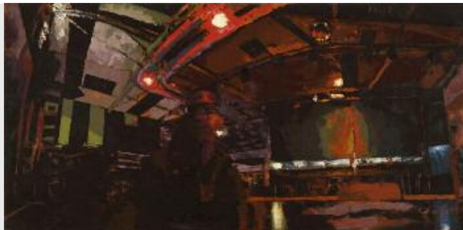
"bog", 2011, Öl auf Leinwand, 70 x 140 cm