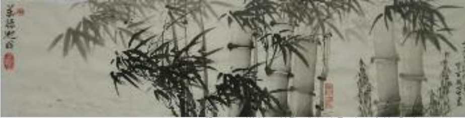
"Der grüne Wald am Li-Fluss", 2012, Tusche auf chin. Papier, 40 x 135 cm

Die eigene spirituelle Idee kann anhand der individuell einzigartigen Pinselführung lebendig und kraftvoll ausgedrückt werden.