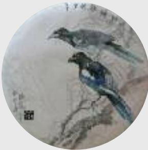
"Das Lied aus dem Weidewald", 2013, chin. Tusche auf Papier, Ø 35 cm

Die chinesische Tuschmalerei ist bekannt für ihren besonderen Ausdruck und Charakter durch die Technik der Pinselführung, die besonderen Malmaterialien und die typischen Motive. Für den Aufbau dieser Werke ist die Harmonie zwischen Form und Freiraum sehr wichtig. Wir beschäftigen uns auch mit der chinesischen Kunstphilosophie und lernen die einzigartige Methode, die spirituellen Energien in unsere Arbeit einfließen zu lassen.