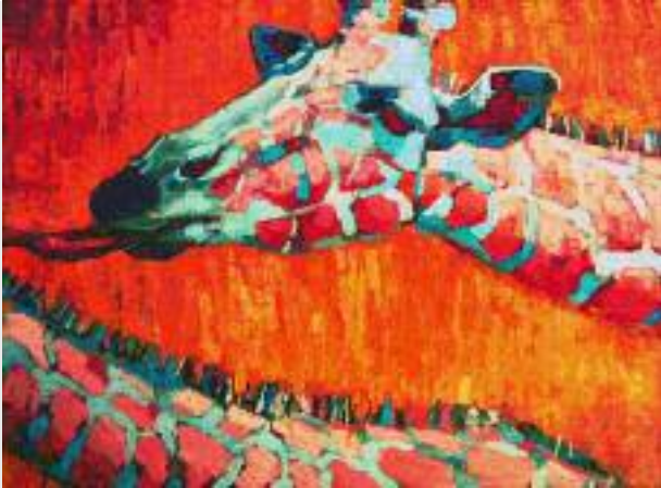
"giraffes on speed", 2003, Öl auf Leinwand, 80 x 100 cm