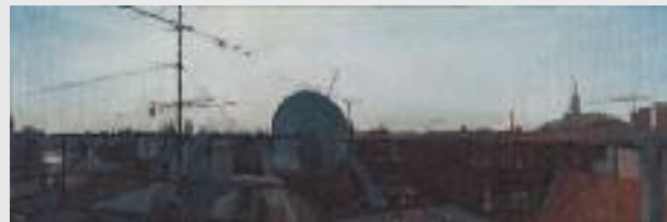
"Vedute 1/2013", Öl auf Leinwand, 30 x 90 cm

max. 12 Teilnehmende Kursbeitrag: € 340,-