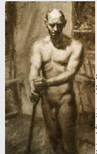
"Andreas", Öl auf Leinwand, 50 x 30 cm

max. 15 Teilnehmende Kursbeitrag: € 180,- Der Modellbeitrag ist von der Teilnehmerzahl abhängig.