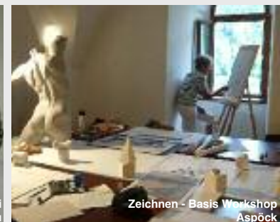
Zeichnen - Basis Workshop Aspöck