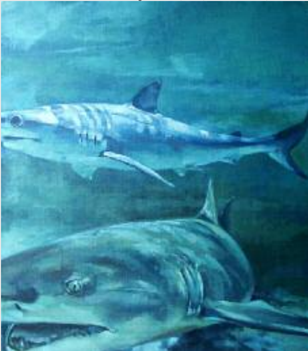
"hunting season 3", 2004, Öl auf Leinwand, 80 x 70 cm