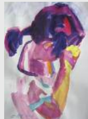
"Chinagirl", 2013, Aquarell auf Papier, 52 x 38 cm

max. 14 Teilnehmende Kursbeitrag: € 180,- Modellgeld: € 20,- bis € 40,- je nach Teilnehmerzahl