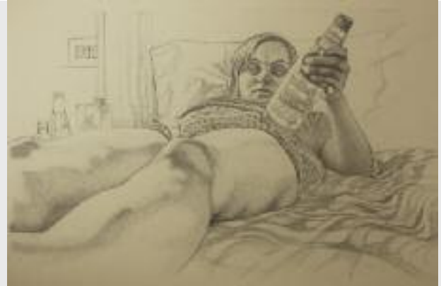
Skizze, 2013, Bleistift auf Papier, 42 x 59,7 cm

Das kreative Experimentieren mit verschiedenen Zeichen- materialien (Kreide, Kohle, Rö-