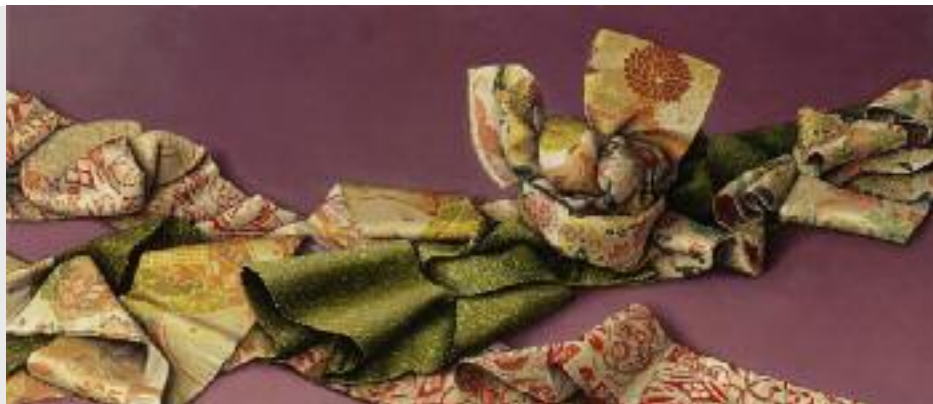
"ornamentale Verknüpfung", 2012, Öl/Eitempera auf Holz, 40 x 93 cm