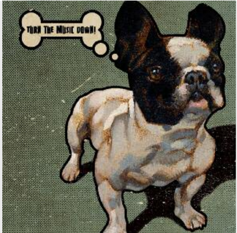
„Turn the music down“, 2006, Öl auf Leinwand / Digital, 25 x 25 cm