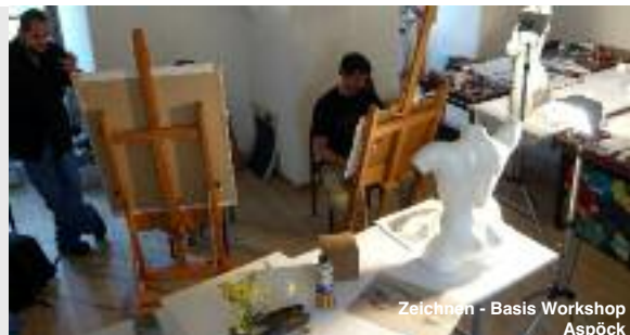
Zeichnen - Basis Workshop Aspöck

Hier bekommen Sie einen kleinen Einblick in das kreative Schaffen. Unsere hellen, gut ausgestatteten Ateliers im mittelalterlichen Schloss bieten Ihnen optimale Voraussetzungen, um sich mit Ihrem künstlerischen Potenzial fruchtbar auseinanderzusetzen.