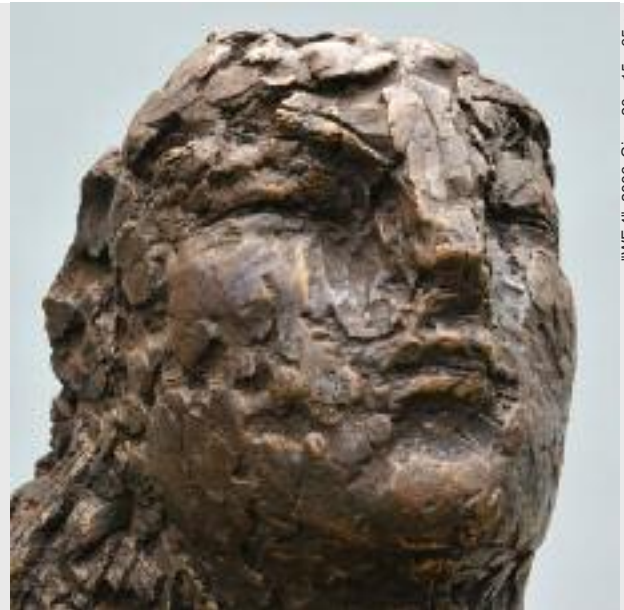
"WF 4", 2006, Gips, 20 x 15 x 65 cm