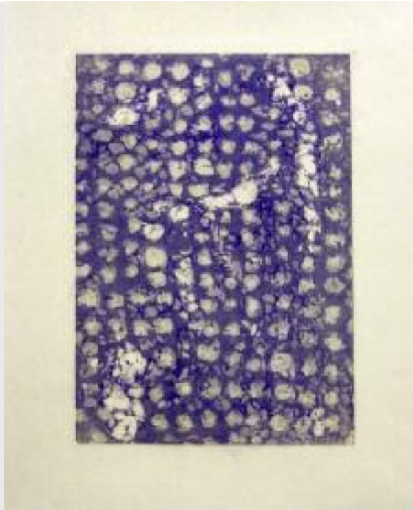
"um zu sehen", 2011, Holzschnitt auf japanischem Papier, 42 x 32 cm

1978 geboren in Gunma, aufgewachsen in Fukushima, Japan.