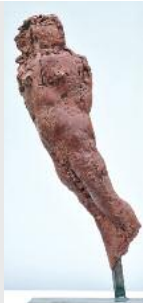
"Frau im Wind", 2012, Bronze, 93 x 37 x 133 cm