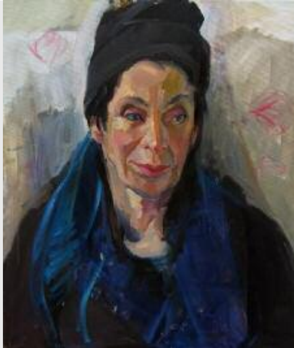
"Claudia", 2013, Öl auf Baumwolle, 70 x 60 cm

Schon mit den drei Grundfarben Gelb-Rot-Blau und Weiß kann man die Hauttöne mischen und Bilder unterschiedlichster Farbstimmung schaffen.