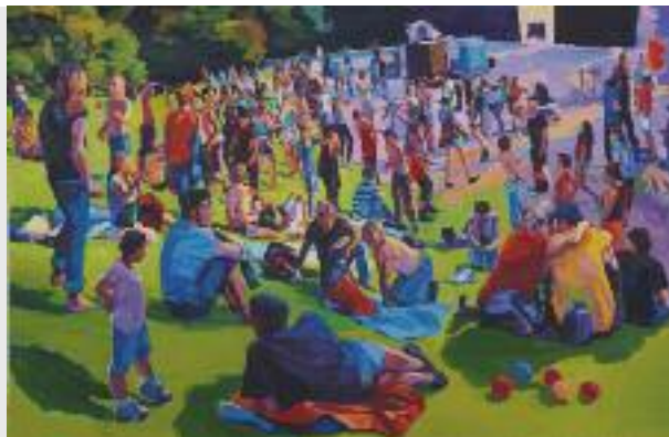
"Sommerabend-Licht", 2012-2013, Öl auf Leinwand, 190 x 290 cm