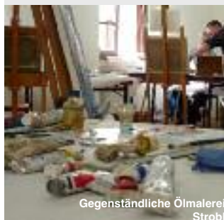
Gegenständliche Ölmalerei Strobl